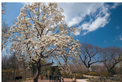
京王フローラルガーデン アンジェ

京王多摩川駅に隣接する欧風庭園「京王フローラルガーデン アンジェ」を運営しています。また、京王プラザホテルや京王プレッソイン等、グループ各社の事業拠点となる不動産の開発、賃貸を行っています。その他、多摩エリアにおける「学生マンション事業」など、新たな不動産開発メニューの展開・検討を進めています。