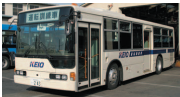
運転技術指導訓練車

京王電鉄バスグループでは、運転技術指導訓練車を導入し、運転操作や安全確認の実施状況などを収集・分析して個別に指導する教育を、新たに開始しました。