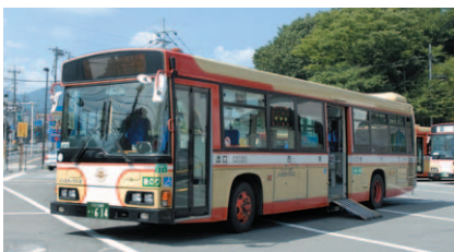
西東京バスのノンステップバス

京王自動車はタクシー・ハイヤーによる自動車運送業を都区内、多摩全域、神奈川県の一部などで営業しています。ETC導入に伴う高速料金割引額のお客様への還元などを実施するほか、症状の軽い患者を搬送する民間救急タクシー「サポートCab」サービスを多摩地区で行っています。さらに「ドライブレコーダー」の全車への装備や、警視庁主催の「セーフティドライバー・コンテスト」に参加し優秀な成績を修めるなど、お客様から信頼されるタクシー・ハイヤーを目指し努力しています。