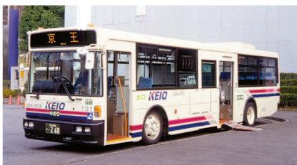
京王電鉄バスのノンステップバス