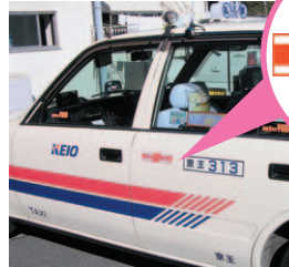
民間救急タクシー「サポートCab」

京王自動車はタクシー・ハイヤーによる自動車運送業を都区内、多摩全域、神奈川県の一部などで営業しています。ETC導入に伴う高速料金割引額のお客様への還元などを実施するほか、症状の軽い患者を搬送する民間救急タクシー「サポートCab」サービスを多摩地区で行っています。さらに「ドライブレコーダー」の全車への装備や、警視庁主催の「セーフティドライバー・コンテスト」に参加し優秀な成績を修めるなど、お客様から信頼されるタクシー・ハイヤーを目指し努力しています。