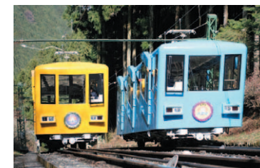
御岳登山鉄道の新型車体

御岳登山鉄道では、老朽が進んだケーブルカーの車体をリニューアルしました。新しいケーブルカーは、今までよりも明るく快適な車内で、お客様に親しまれるよう心がけました。