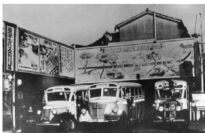
1940（昭15）年頃のバスの新宿追分折返場