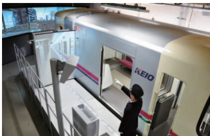
運転シミュレータ

コンピュータ・グラフィック(CG)映像を活用した運転士訓練機能および車掌訓練機能があります。昼夜、降雨などさまざまな条件が設定でき、乗務員の教育や異常時対応訓練などを行っています。