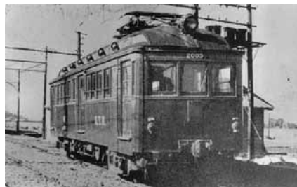
京王帝都電鉄（現 京王電鉄）発足当時の電車