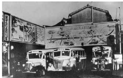
1940（昭15）年ごろのバスの新宿追分折返場