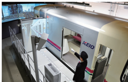
運転シミュレータ

コンピュータ・グラフィック(CG)映像を活用した運転士訓練機能および車掌訓練機能があります。昼夜・降雨などさまざまな条件が設定でき、乗務員の教育や異常時対応訓練などを行っています。