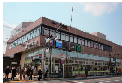
京王リトナード永福町

利用者や地域住民の方々の生活に密着した店舗を取りそろえたデイリー型商業施設。スーパーマーケット・書店など毎日の生活にあると便利な“ちょっといい”を提供していきます。