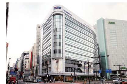
京王新宿追分ビル

2001(平13)年に竣工。地下2階・地上9階、延床面積13,008㎡。4階から9階をオフィスとして賃貸し、低層階には店舗が入っています。