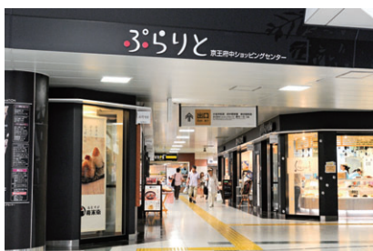
京王府中ショッピングセンター「ぷらりと」