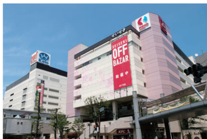
京王聖蹟桜ヶ丘ショッピングセンター