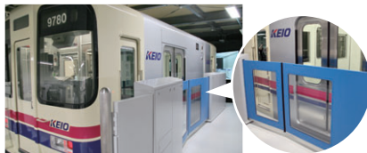
運転シミュレータ