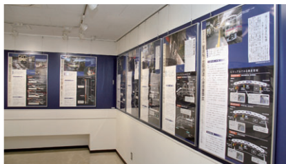
事事故事例のパネル展示

鉄道教習所は、国土交通大臣指定の動力車操縦者の養成所として運転士に必要な知識・技能の教育を行っているほか、事事故事例のパネルやCAI(コンピュータ支援教育)教材の製作など、2006(平18)年度の大規模改修以降も部門全体に活用できる教育施設の充実を図っています。