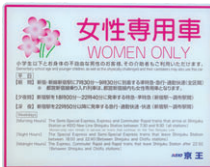
女性専用車案内ステッカー

なお、女性専用車には女性のお客様のほか、小学生以下のお客様、お身体の不自由なお客様とその介助者もご乗車いただけます。