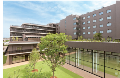
アリスタージュ経堂

安心の医療と充実した介護、京王グループ各社が連携した生活サービスを提供することにより、充実したシニアライフをサポートします。