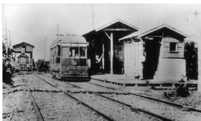
1914(大3)年頃の調布駅と電車

戦時下にあった1944(昭19)年、京王電気軌道は戦時立法により、東京急行電鉄株式会社と合併しました。その後、旧京王電気軌道は、同様に合併していた旧帝都電鉄(現 井の頭線)とともに、1948(昭23)年6月1日に東京急行電鉄から分離し、「京王帝都電鉄株式会社」として発足しました。