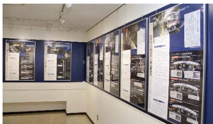
事故事例のパネル展示

鉄道教習所は、国土交通大臣指定の動力車操縦者の養成所として運転士に必要な知識・技能の教育を行っているほか、事故事例のパネル展示やCAI(コンピュータ支援教育)教材の導入など、部門全体で活用できる教育施設の充実を図っています。