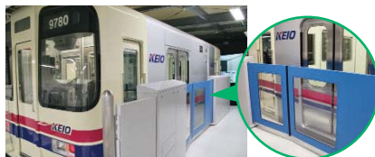
訓練の様子(上)、ホームドアの訓練装置(下)