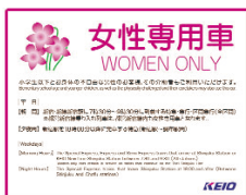
女性専用車案内ステッカー

なお、女性専用車には女性のお客様のほか、小学生以下のお客様、お身体の不自由なお客様とその介助者もご乗車いただけます。