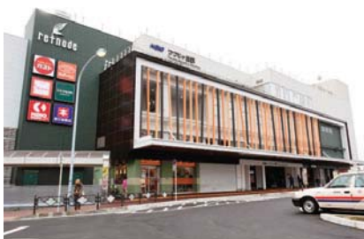
京王リトナードつつじヶ丘

利用者や地域住民の方々の方に生活に密着した店舗を取りそろえたデイリー型商業施設。スーパーマーケット・書店など毎日の生活にあると便利な“ちょっといい”を提供しています。