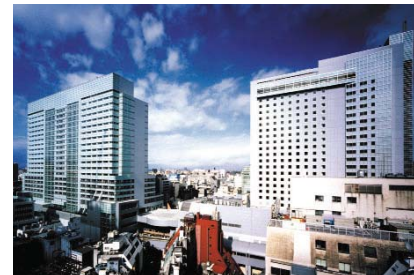
渋谷マークシティ

2000(平12)年に竣工。JR渋谷駅寄りのビル「イースト」(ホテル棟)と道玄坂上寄りのビル「ウエスト」(オフィス棟)からなる複合施設で、合計延床面積約140,000㎡。「イースト」は、渋谷エクセルホテル東急、店舗(物販・飲食)などからなる地下2階・地上25階、「ウエスト」は、オフィス、店舗(物販・飲食)、駐車場などからなる地下1階・地上23階。ビル管理・運営は、東京地下鉄株式会社、東京急行電鉄株式会社との三社共同出資会社である、株式会社渋谷マークシティが行っています。