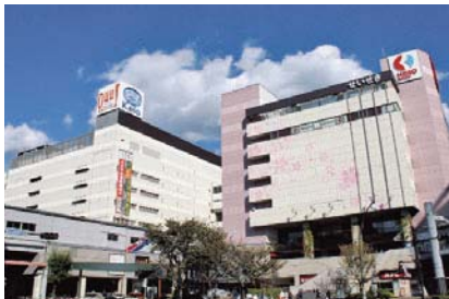
京王聖蹟桜ヶ丘ショッピングセンター