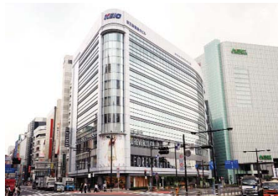
京王新宿追分ビル

2001(平13)年に竣工。地下2階・地上9階、延床面積13,008㎡。4階から9階をオフィスとして賃貸し、低層階には店舗が入っています。