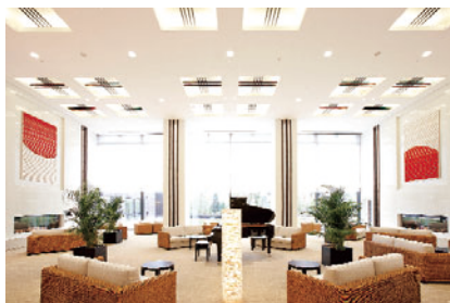
アリスタージュ経堂

安心の医療と充実した介護、京王グループ各社が連携した生活サービスを提供することにより、充実したシニアライフをサポートしています。