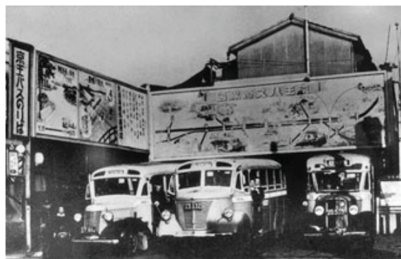
1940(昭15)年頃のバスの新宿追分折返場