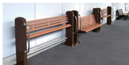
座面の高さや形状が異なるユニバーサルベンチ

お子様からお年寄りの方までどなたにも快適にご利用いただけるよう、座面の高さや形状が異なる3タイプの「ユニバーサルベンチ」を導入しています。ベンチの支柱には立ち上がる際などにお使いいただける手すりを設けています。なお、材料の一部には、使用済み定期券などをリサイクルしています。