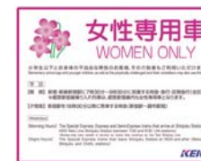
女性専用車案内ステッカー

なお、女性専用車には女性のお客様のほか、小学生以下のお客様、身体の不自由なお客様とその介助者もご乗車いただけます。