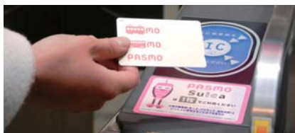
※PASMOは株式会社バスモの登録商標です

当社では、全ての自動改札機でご利用いただけるほか、全69駅にチャージ(入金)ができる自動券売機またはチャージ機を設置しています。