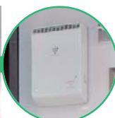
プラズマクラスターイオン発生装置