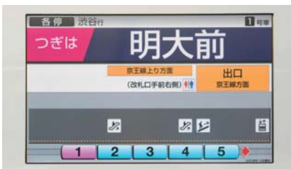
液晶画面を用いた案内表示器