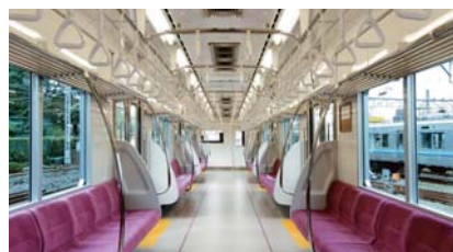
ユニバーサルデザインによる車内の一例

新造車両の導入や既存車両のリニューアルでは、ユニバーサルデザインの考え方を採り入れ、つり革や荷棚の高さを低くし、手すりやつり革は握りやすい形状にしています。さらに座席端部に仕切り板を設置するなど、全てのお客様にご利用しやすい車内環境の整備を進めています。