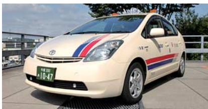
ハイブリッドタクシー