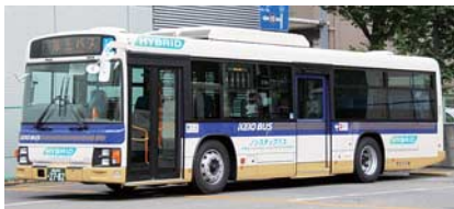
ハイブリッドバス

京王電鉄バスグループでは、ハイブリッドバスや車内照明をLED化した車両を導入しています。また、西東京バスにおいてもハイブリッドバスの導入や電気バスの受託運行、京王自動車ではハイブリッドタクシーやアイドリングストップ機能付きタクシーを導入するなど省エネルギー化に取り組んでいます。