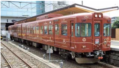
旧京王線5000系（富士急行株式会社）

京王線・井の頭線で活躍していた車両が、色やデザインを変え現在でも全国各地の鉄道で運行しています。