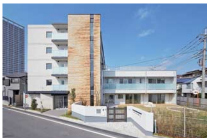
京王アンフィール国領

安心・安全・便利に暮らせる機能やデザインが充実しています。2008(平20)年には認証保育所併設の「京王アンフィール高幡」、2016(平28)年にはシリーズ2物件目となる認可保育所併設の「京王アンフィール国領」が竣工しました。