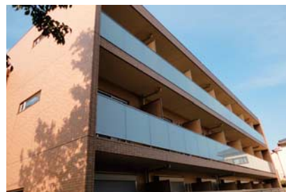
フィシオ国立富士見台

2009(平21)年にはフィシオシリーズとしては初めて京王建設の規格型賃貸マンションシリーズ「リプラ」を採用した「フィシオ橋本第2」が、2014(平26)年にはシリーズ7物件目となる「フィシオ国立富士見台」が竣工しました。