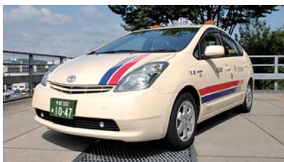
ハイブリッドタクシー