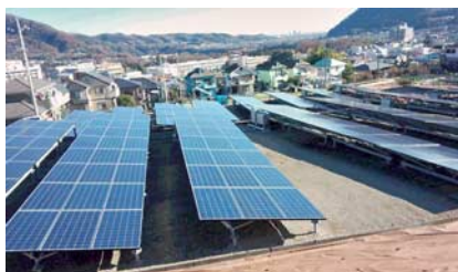
相模原市の発電設備

京王グループでは、再生可能エネルギーの活用に積極的に取り組んでいます。2015(平27)年には、相模原市の社有地において、太陽光発電事業を開始しました。