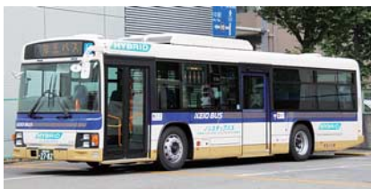
ハイブリッドバス

京王電鉄バスグループでは、ハイブリッドバスや車内照明をLED化した車両を導入しています。また、西東京バスではハイブリッドバスの導入や電気バスの受託運行、京王自動車ではハイブリッドタクシーやアイドリングストップ機能付きタクシーを導入するなど省エネルギー化に取り組んでいます。