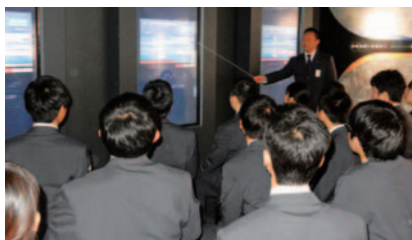
デジタルサイネージを用いた教育

当社および他社における過去の事故やインシデントについて、デジタルサイネージを活用し、当時の資料や映像を通して事故の経緯や原因などを学ぶことができます。