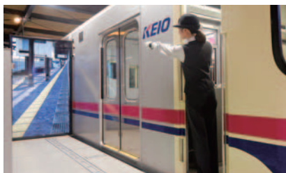
訓練の様子(上：運転士、下：車掌)