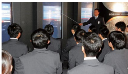
デジタルサイネージを用いた教育

当社および他社における過去の事故やインシデントについて、デジタルサイネージを活用し、当時の資料や映像を通して事故の経緯や原因などを学ぶことができます。