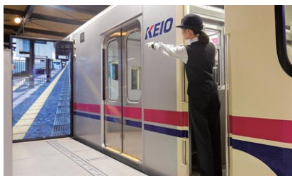
訓練の様子(上：運転士、下：車掌)