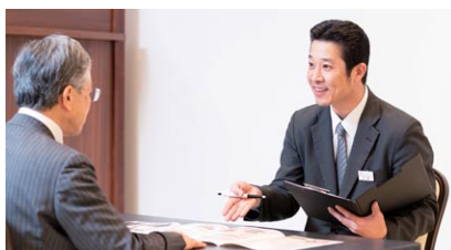
葬儀の事前相談の様子

葬儀の施行をはじめ、事前相談から葬儀後手続きまでトータルサポートを行い、沿線の生活サービスの充実に寄与します。