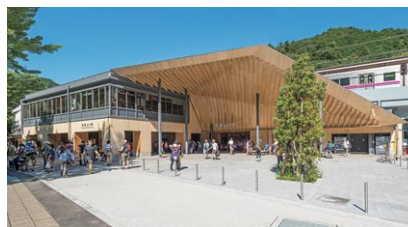
施工した高尾山の玄関「高尾山口駅舎」

京王沿線や都心を中心に、建築・土木工事のコンサルティング、設計、施工を実施しています。