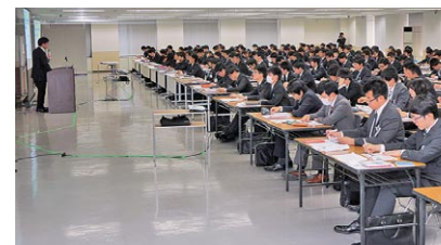
京王グループ合同研修の様子