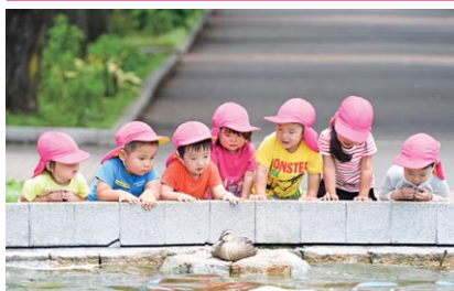
京王キッズプラッツでの保育の様子(戸外活動)