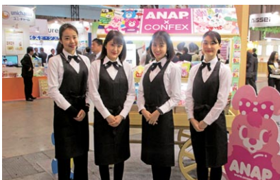
イベントコンパニオン