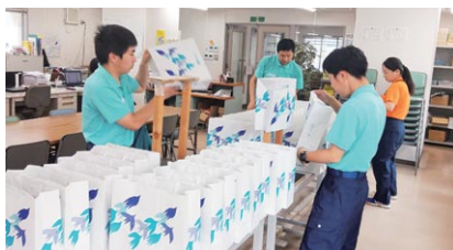
グループ会社での軽作業の様子

障がい者雇用促進を目的として設立。全社員が生き生きと仕事のできる環境を整備し、地域社会に貢献しています。