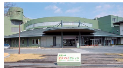
高尾の森わくわくビレッジ