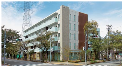
スマイラス聖蹟桜ヶ丘