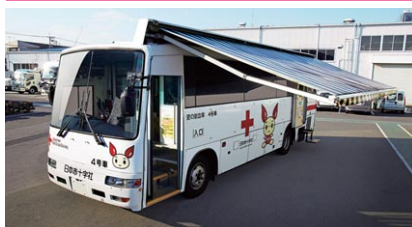
日本赤十字社 中型採血車

特殊車両製造におけるトップクラスのメーカーとして、お客様のニーズにあったさまざまな車両を受注生産しています。高い評価を得ている医療関連特殊車両の他、全国各地のジョイフルバスや各種イベント車、消防・警察関連の防災関連車両など幅広いジャンルに対応した車両の製造・改造や修繕工事を行っています。