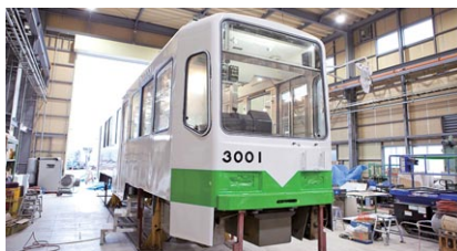
函館市企業局 路面電車の車体改良工事を受注

鉄道車両の整備、改修工事を主な事業として、全国各地から幅広い業務を受注しています。また、特殊車両の製作や、メルクマール京王笹塚などの建物運営を行っています。