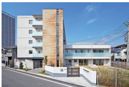
京王アンフィール国領