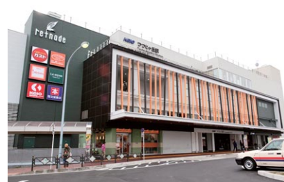
京王リトナードつつじヶ丘

利用者や地域住民の方々の生活に密着した店舗を取りそろえたデイリー型商業施設。スーパーマーケット・書店など毎日の生活にあると便利な“ちょっといい”を提供しています。