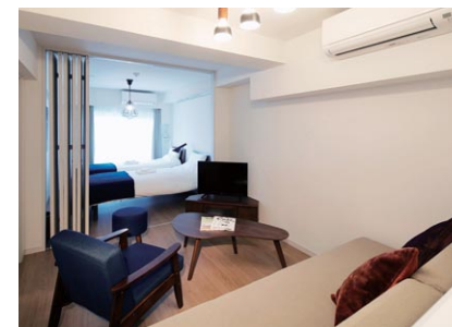
KARIO SASAZUKA TERRACE

新しい宿泊・滞在スタイルを提案する中長期滞在者向けの宿泊施設。2017(平29)年に第1号店として「KARIO KAMATA」を、2019(平31)年に2号店「KARIO SASAZUKA TERRACE」をオープンしました。インバウンド需要や多様化する宿泊・滞在ニーズに応え、自宅に居るような感覚で「暮らすように泊まる」ことができる設備を備えています。