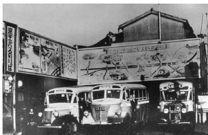
1940年頃のバスの新宿追分折返場