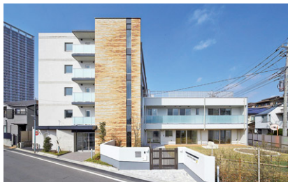
京王アンフィール国領