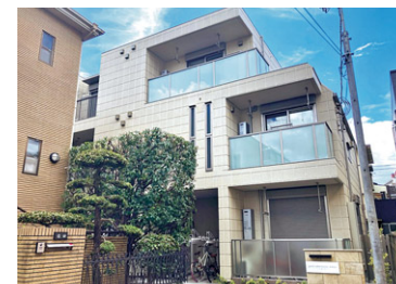
フィシオ桜上水テラス