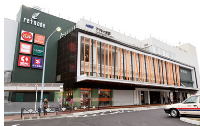
京王リトナードつつじヶ丘

利用者や地域住民の方々の生活に密着した店舗を取りそろえたデイリー型商業施設。スーパーマーケット・書店など毎日の生活にあると便利な“ちょっといい”を提供しています。