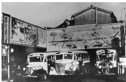
1940年頃のバスの新宿追分折返場