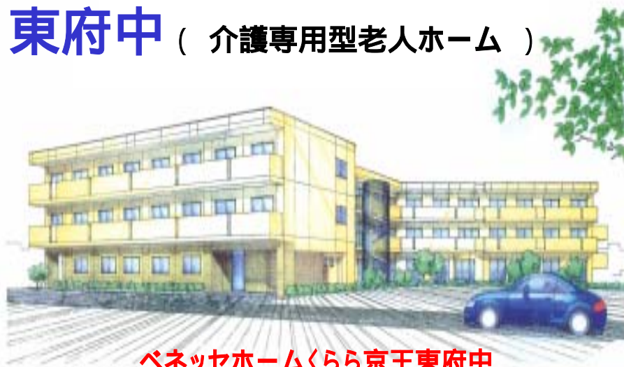
ベネッセホームくらら京王東府中