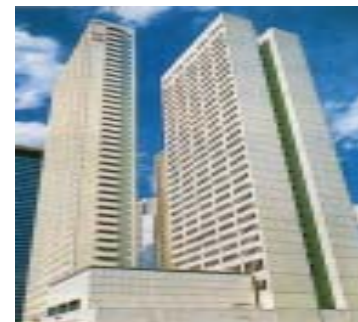
京王プラザホテル