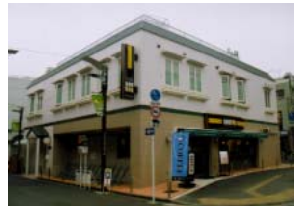
ポピンズナーサリー京王