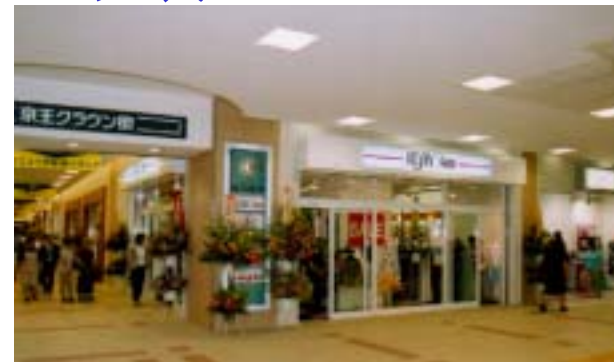
京王クラウン街笹塚