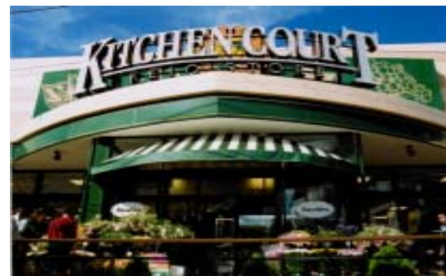
キッチンコート(桜上水店)