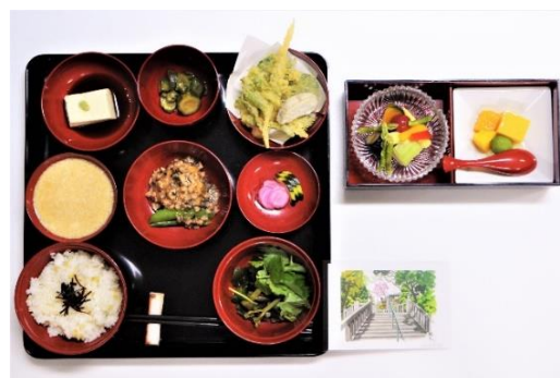
高尾山薬王院 精進料理（イメージ）