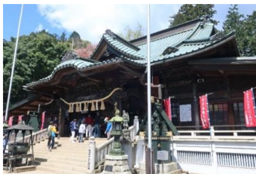
高尾山薬王院 大本堂