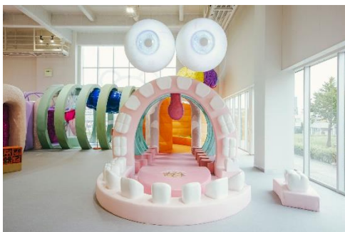
アトラクション一例 (体内探検)