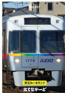
京王電鉄オリジナル はてなカード一例