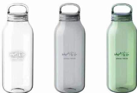
《オリジナルウォーターボトル》