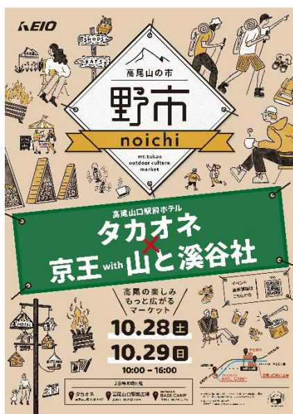
《高尾山の市 “野市” ポスタービジュアル》