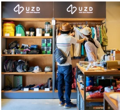
《出店例：UZD/アウトドアギアリユース品》