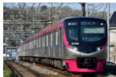
《京王ライナー(イメージ)》