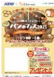
《イベントポスター(イメージ)》