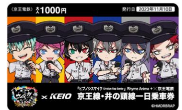
◀京王線・井の頭線一日乗車券▶