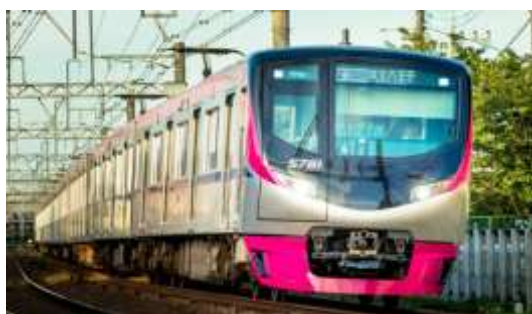
≪京王ライナー(イメージ)≫