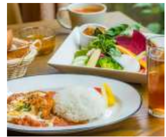
《タカオネキッチン 料理》

期間中に、有料座席指定列車の臨時「京王ライナー高尾山口行き」または「Mt. TAKAO号」の座席指定券（WEB購入画面も可）を店舗でご提示いただいたお客さまを対象に、タカオネキッチンでの食事がお会計より10%割引になるキャンペーンを実施します。