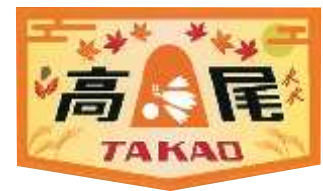
《オリジナルヘッドマーク（イメージ）》

※車両検査および運用の都合により運行しない日があります。また、取り付け期間を変更する場合があります。