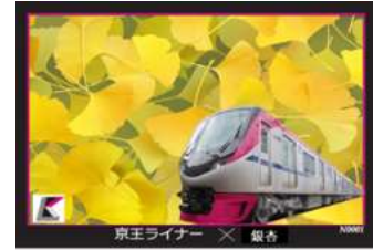
《記念トレーディングカード（イメージ）》