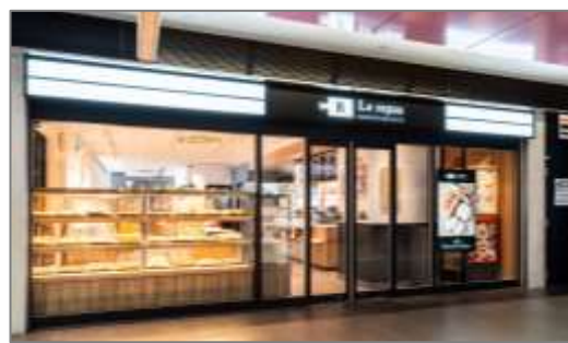
≪ベーカリー&amp;カフェ ルパ≫