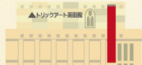
▲トリックアート美術館